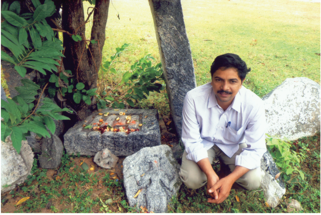
బమ్మెర గ్రామములో పోతన మందిరం వద్దగల సీతారాముల పాదుకలు