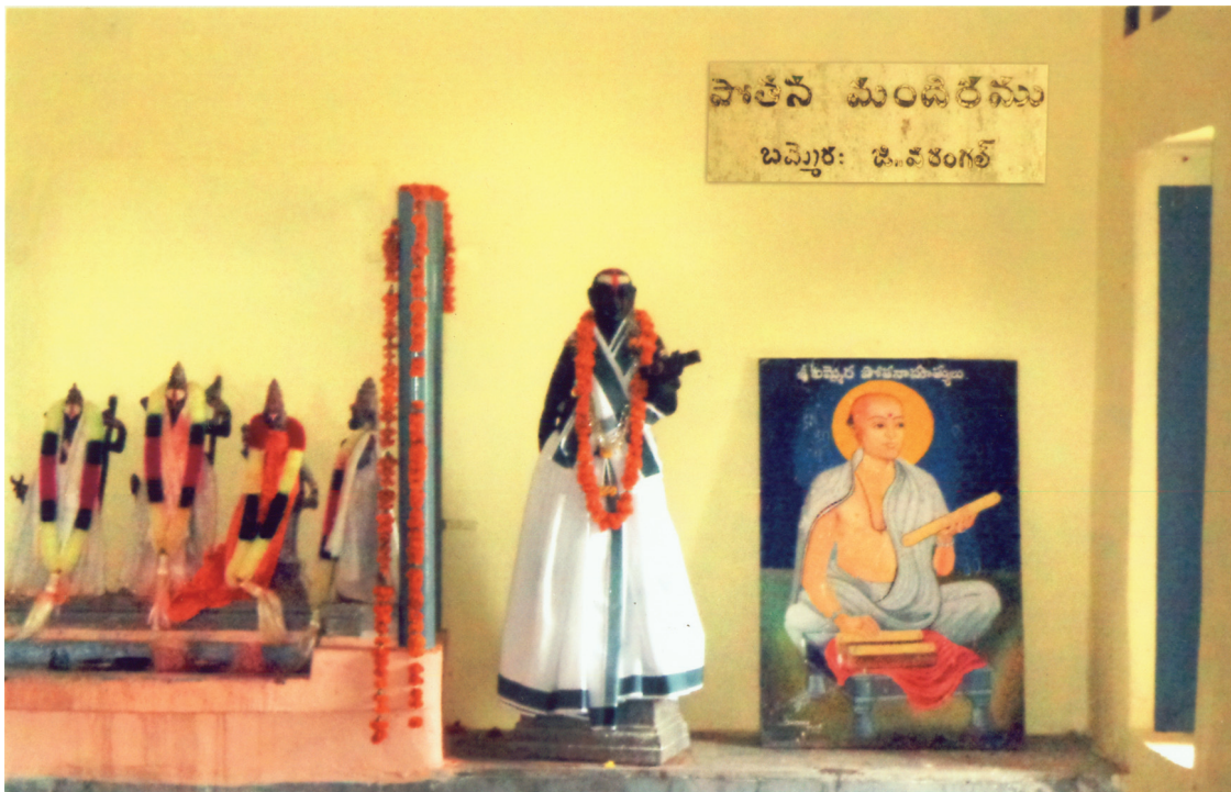
పోతన మందిరం లోపల శ్రీసీతారాముల విగ్రహములు మరియు పోతన గారి విగ్రహం