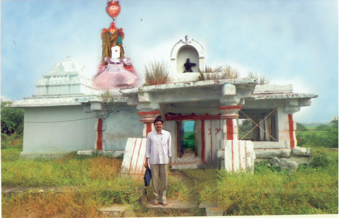
పోతన తండ్రి కేతనగారిచే నిర్మించబడిన బమ్మెర గ్రామములోని శివాలయం ఇన్ సెట్ లో శివలింగం.