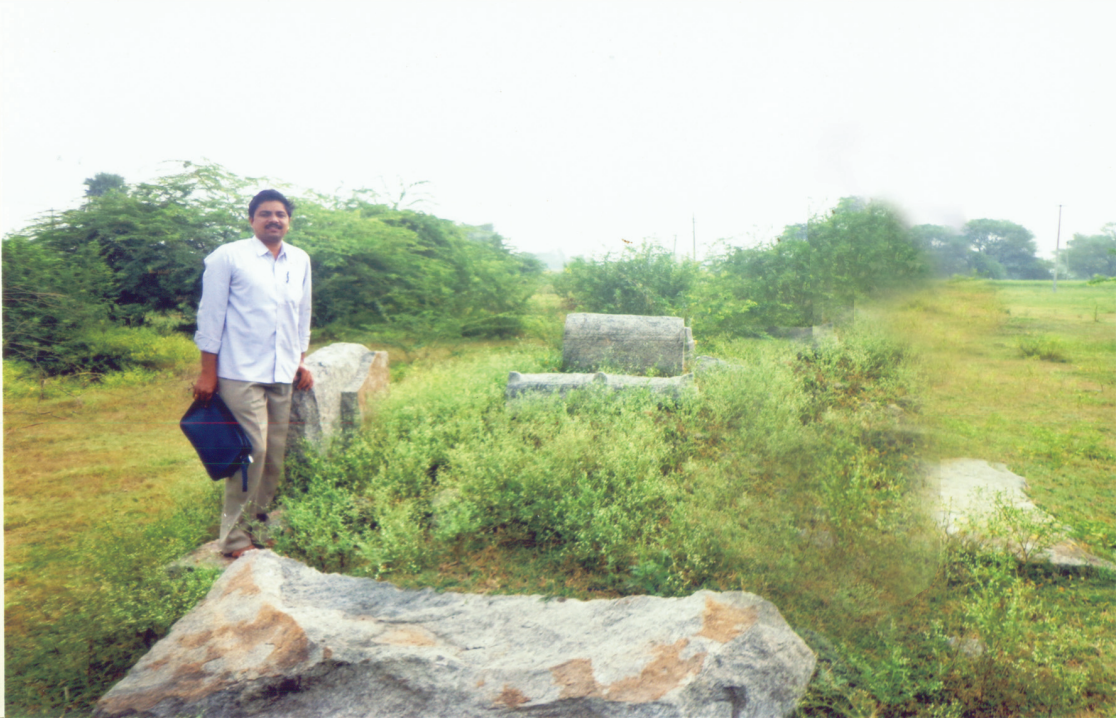
పోతన నిర్యాణానంతరం దహన సంస్కారములు గావించిన ప్రదేశము