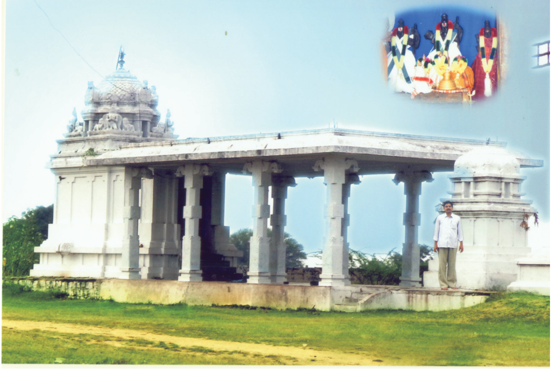
పోతన గారు నిత్యము దర్శించుకున్న బమ్మెర గ్రామములోని శ్రీ రామాలయం ఇన్ సెట్ లో విగ్రహాలు