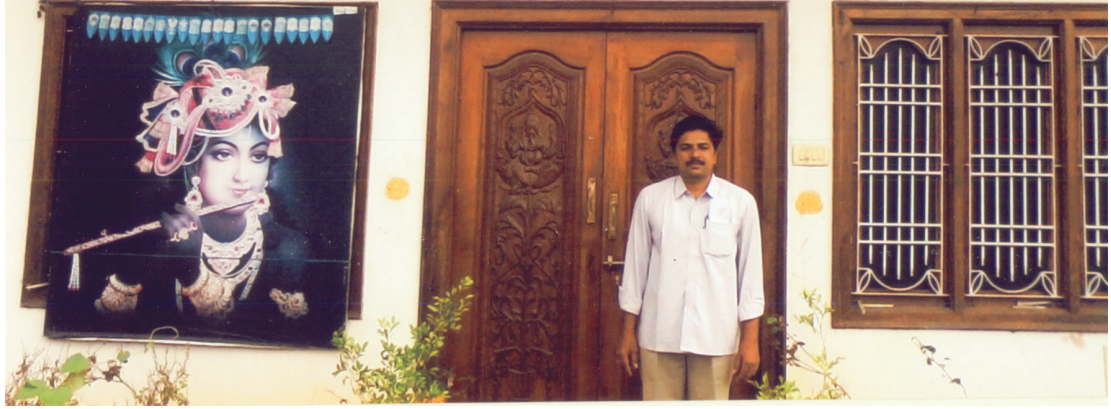
సద్గురు శ్రీ నారాయణతీర్థ ధ్యాన మందిరము, కాజ