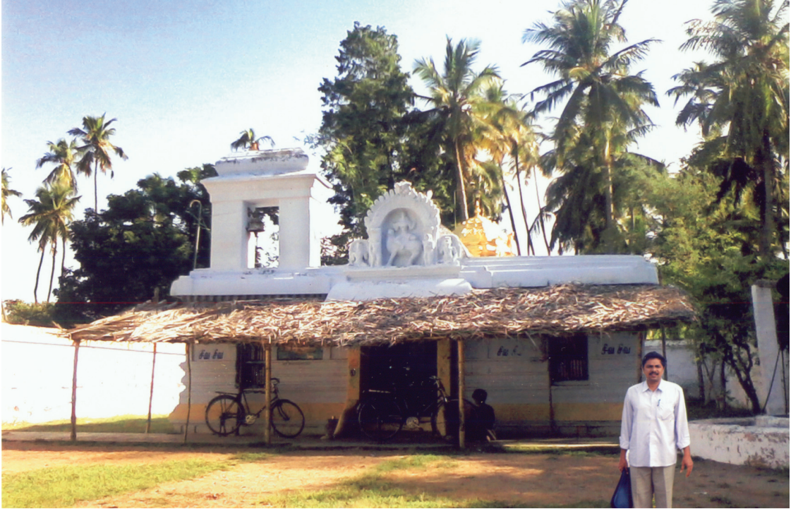
సద్గురు శివ నారాయణ తీర్థలు నిర్యాణము పొందిన చెన్నై రాష్ట్రం, తంజావూరుకు 16 కిలోమీటర్ల దూరంలోగల తిరుప్పందుర్తి గ్రామములోని ఆలయం.