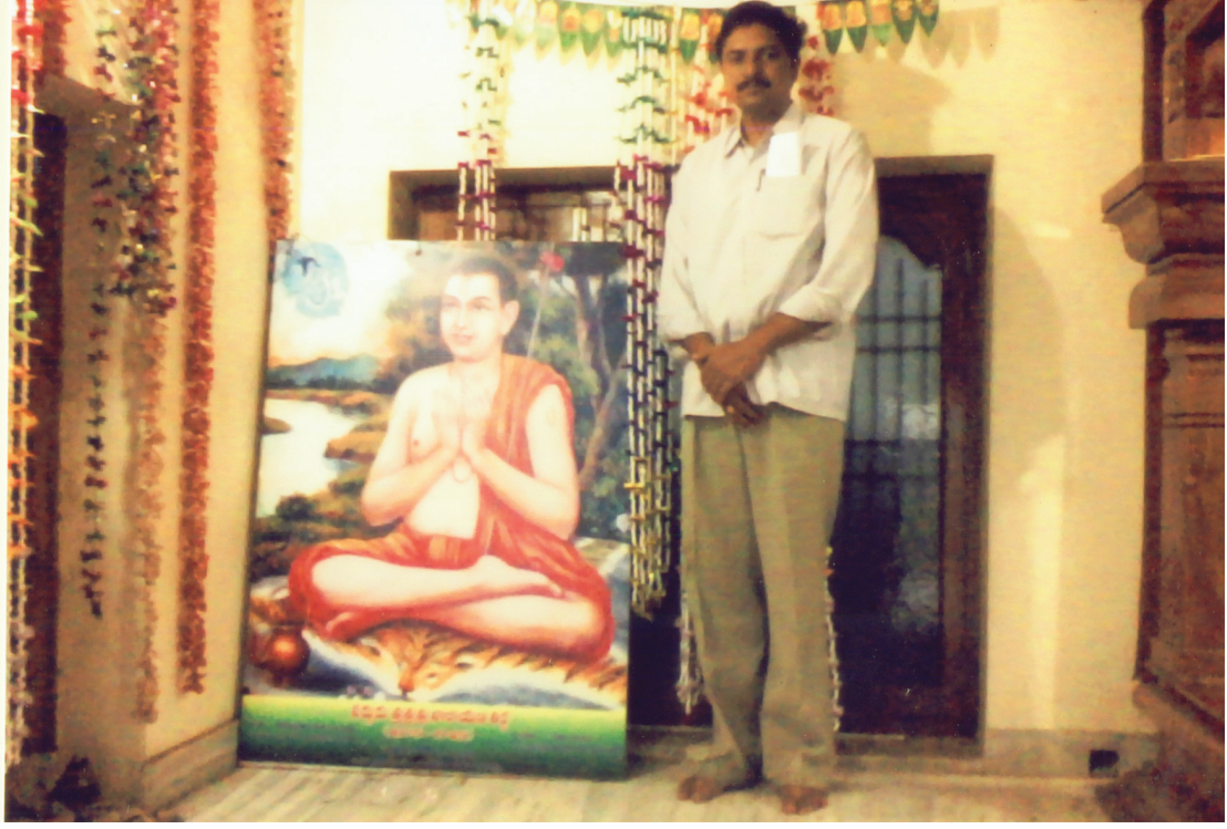
నారాయణ తీర్థల జన్మస్థలం గుంటూరుజిల్లా, మంగళగిరి మండలం, కాజ గ్రామం నారాయణ తీర్థ మందిరంలో గల తీర్థల వారి చిత్రపటం