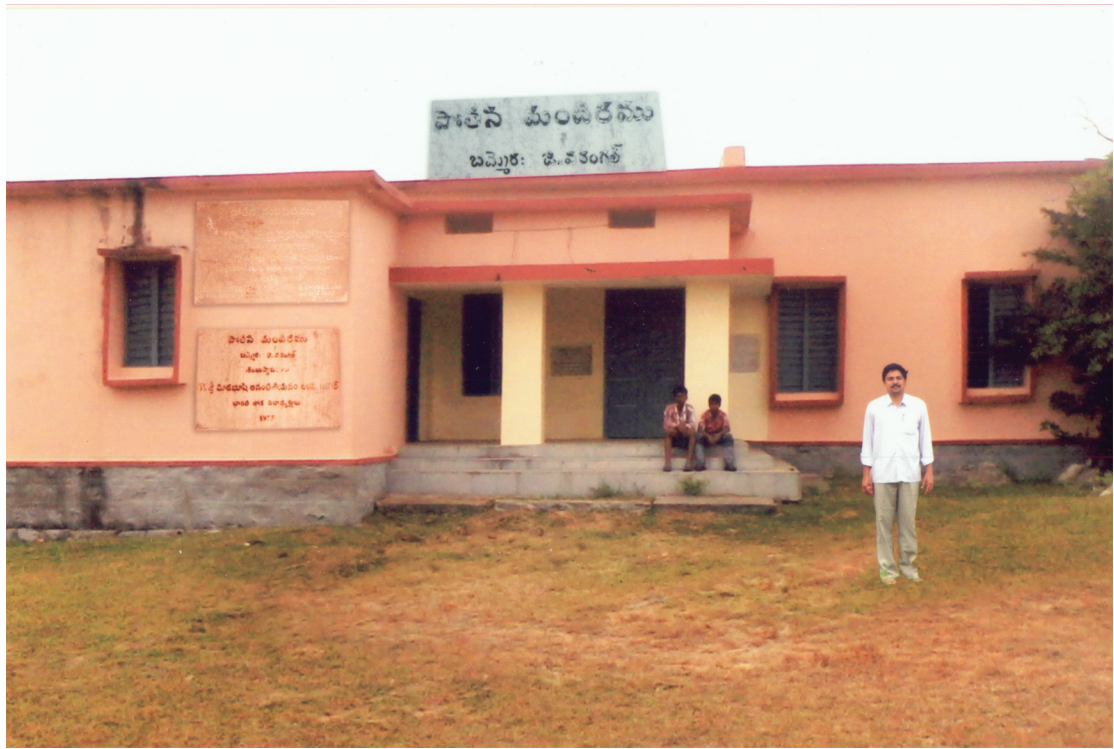
స్వర్ణీయ మాజీ ప్రధాని పి.వి. నరసింహారావు గారిచే ప్రారంభోత్సవం చేయబడిన పోతన మందిరం